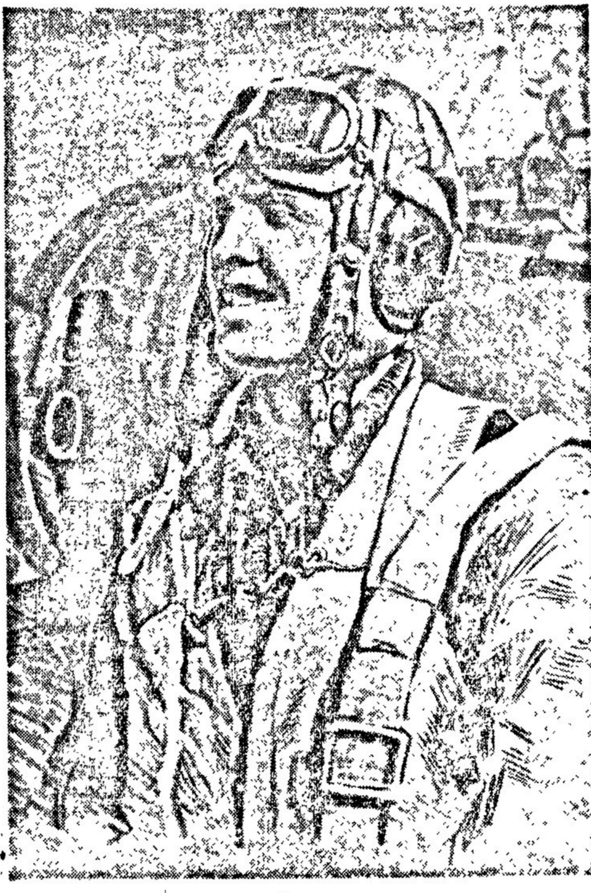
Портрет лётчика. Художник Ю. НЕПРИЦЕВ. Первая выставка художников Ленинградского фронта.